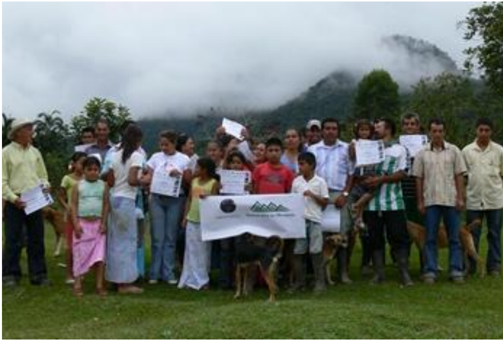
COMPROMETIDOS CON LA CONSERVACIÓN DE LA BIODIVERSIDAD DE LA SERRANÍA DEL PINCHE- CORREDOR PARAGUAS MUNCHIQUE